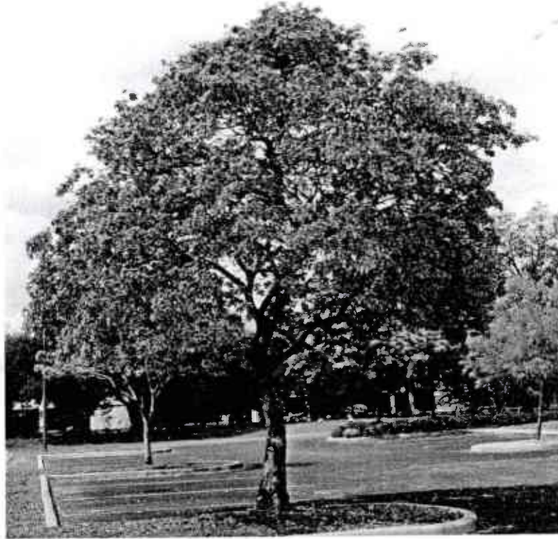
ต้นไม้ประจำสถาบัน

ข้อบังคับสถาบันการอาชีวศึกษาภาคกลาง ๔ ว่าด้วยตรา สัญลักษณ์ เครื่องหมายของสถาบัน เครื่องแบบ เครื่องหมาย และเครื่องแต่งกายของนักศึกษาระดับปริญญาตรี (ฉบับที่ ๒) พ.ศ. ๒๕๖๐